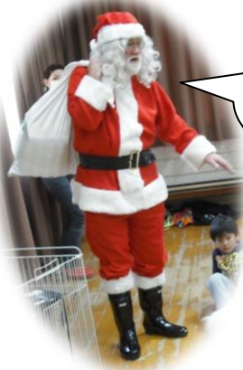
メリークリ スマス!!!